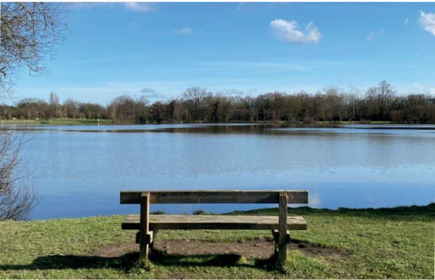
Les étangs d'Apigné

Les espaces naturels comme le Bois de la Motte et le domaine du Château de la Freslonnière, avec son golf et ses jardins, invitent à la détente et aux loisirs en plein air.