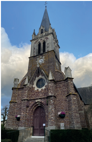
Église Saint-Paul et Saint-Pierre