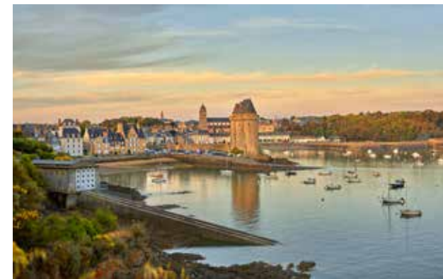
Baie de Saint-Servan