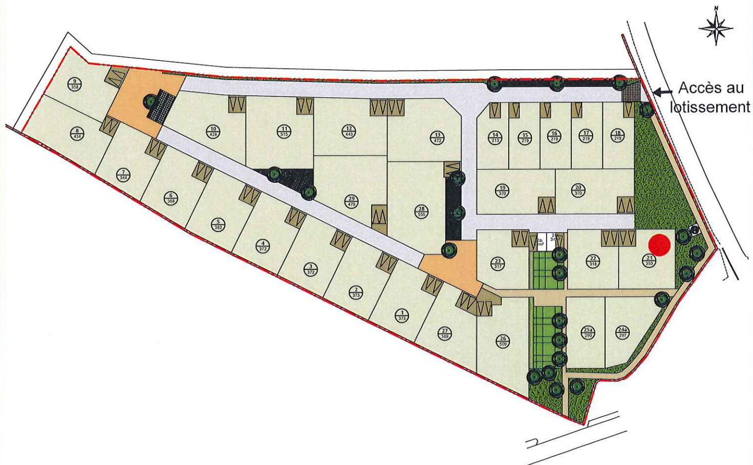
Plan de situation (sans échelle)