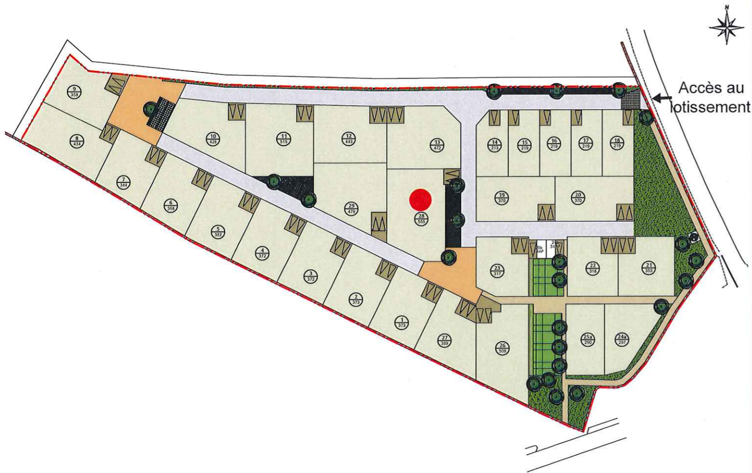
Plan de situation (sans échelle)