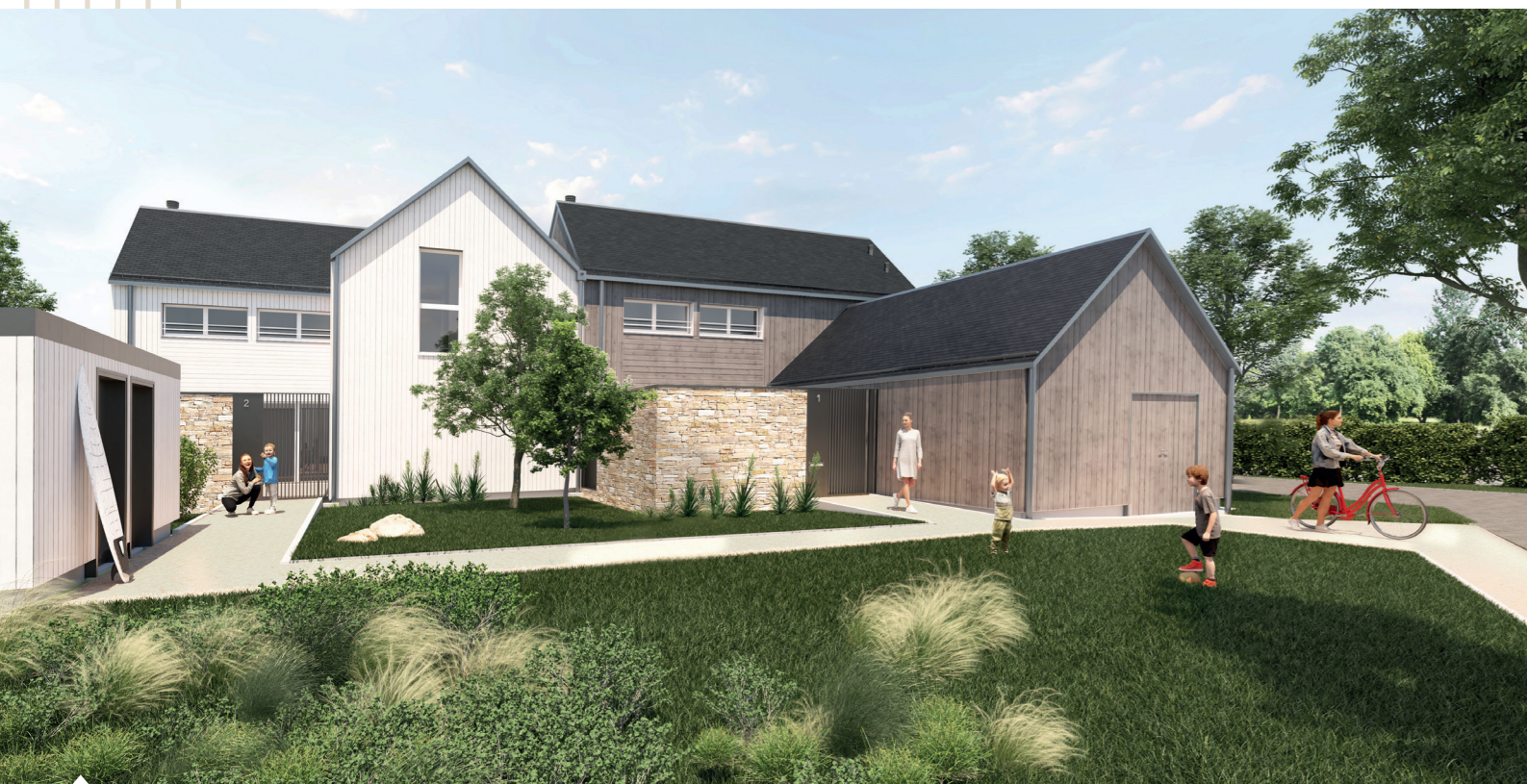
52 avenue de Saint-Colomban à Carnac