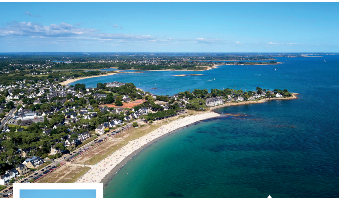
Grande Plage, Pointe Churchill