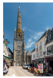
Le bourg de Carnac