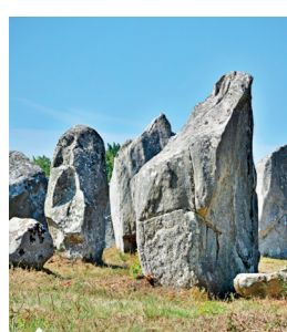
Les Alignements de Carnac

Stratégiquement située entre le golfe du Morbihan et l'océan, Carnac bénéficie d'un emplacement privilégié doté d'un climat doux et ensoleillé .